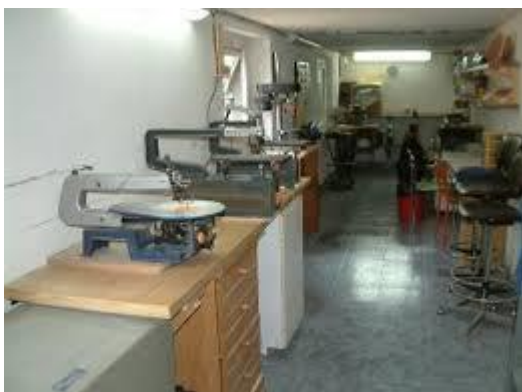
Laboratorio falegnameria e traforo