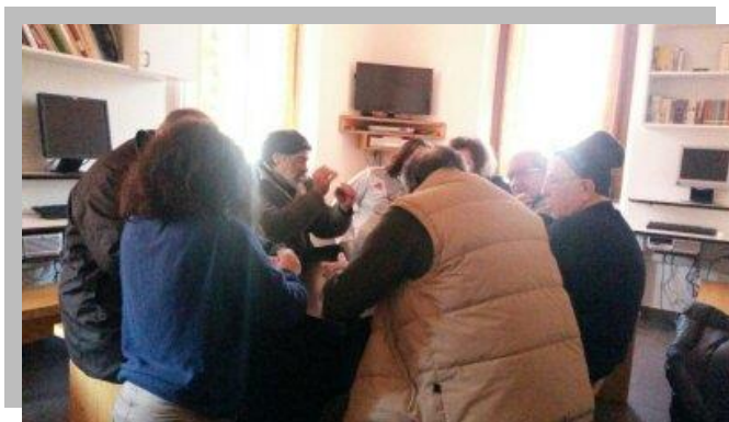
Laboratorio "raccontare e raccontarsi"